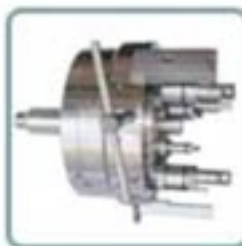
ATTREZZATURA AUTOMATICA DI BASE CHIAVE PER AZIONAMENTO CAMBIO RAPIDO KIT DI PRESA

Quando si vuole lavorare il cono del sincronizzatore la membrana continua a serrare il pezzo, mentre le staffe si aprono ed arretrano lasciando lo spazio per gli utensili o la mola.