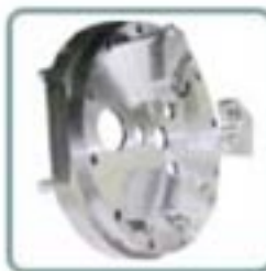
KIT DI PRESA INTERCAMBIABILE CAMBIO RAPIDO