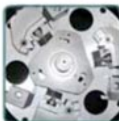
ALLESTIMENTO DI PRESA CON APPOGGIO CAMBIO RAPIDO